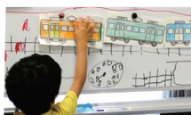
たまおせんせい 美術科教員 公認心理師